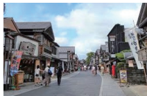
おはらい町・おかげ横丁