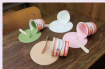
郡上八幡(さんぶる工房)