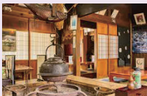
お食事処いろいろ