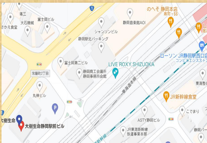
大樹生命静岡駅前ビル